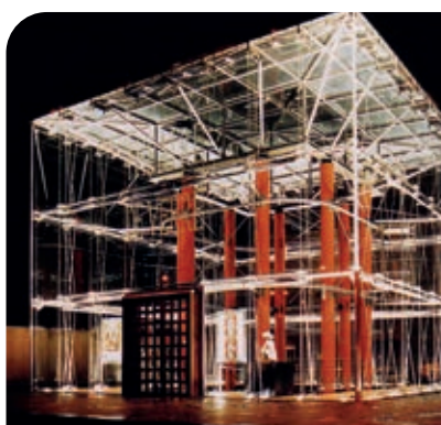
Le théâtre de verre